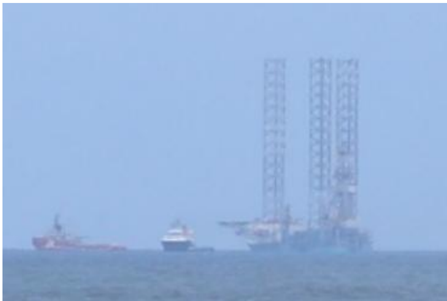
片貝海岸から望む掘削リグ(望遠)