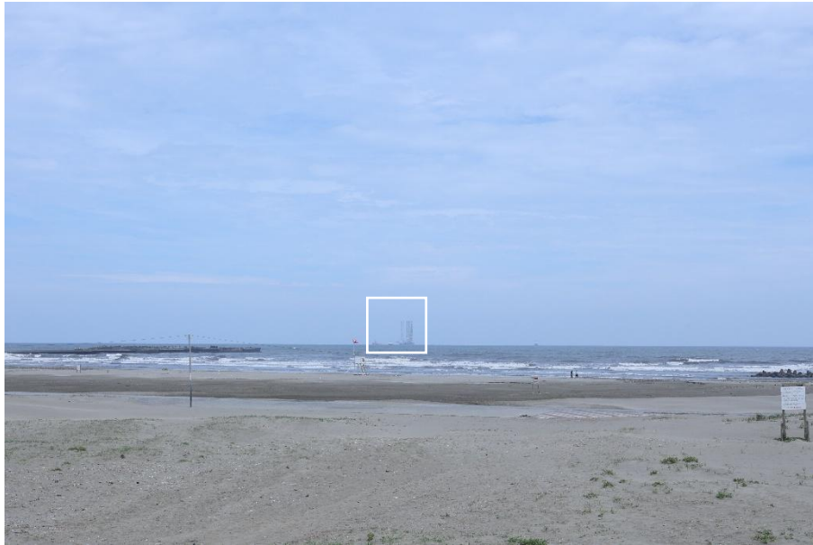
片貝海岸から望む掘削リグ(中央)